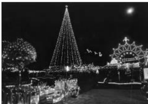
(H21コンテスト最優秀賞「月と夢ナリエ」)