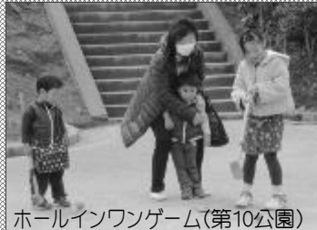
ホールインワンゲーム(第10公園)