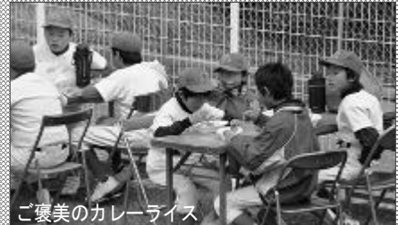
ご褒美のカレーライス