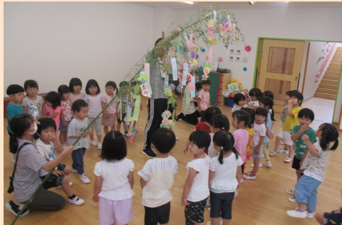
たなばた飾りを作ったよ

水の冷たさが心地よい季節です。子どもたちは水の冷たさや感触を全身で楽しみながら遊んでいます。